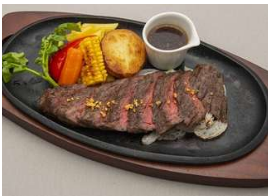
青森県産牛ステーキ