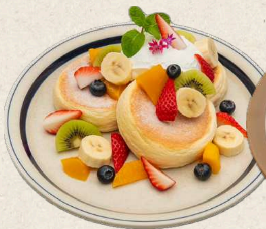
フルーツ パンケーキ