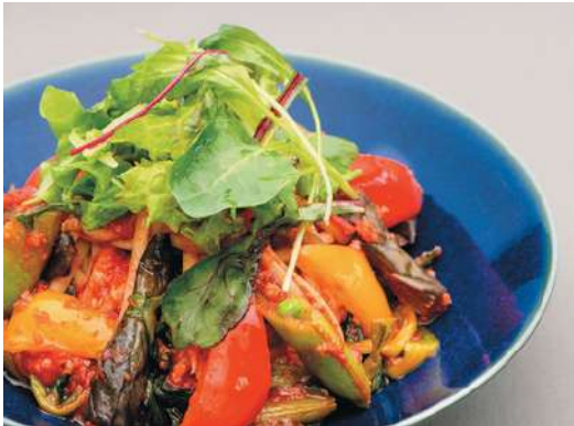
ニンニクを利かせた彩り野菜の トマトソース Garlic Tomato Sauce Pasta with Colorful Vegetables ¥1,430-