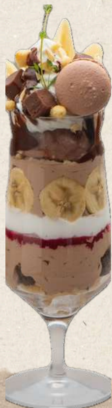
ショコラバナナパフェ