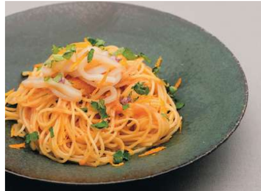
イカと大葉のたらこパスタ 柑橘の香り Squid and Perilla Leaves Cod Roe Pasta with Citrus flavor ¥1,430-