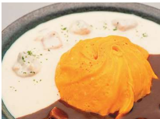
あいがけオムライス Half-and-Half Omelette rice ¥1,430-