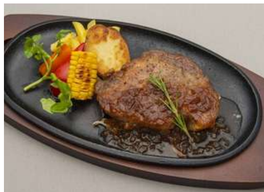
十和田産地養豚のソテー