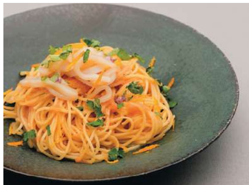
イカと大葉のたらこパスタ 柑橘の香り Squid and Perilla Leaves Cod Roe Pasta with Citrus flavor ¥1,430-