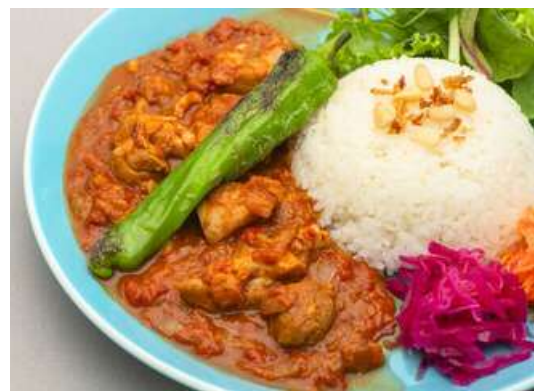
青森県産鶏のスパイスカレー Aomori Chicken Spice Curry ¥1,320-