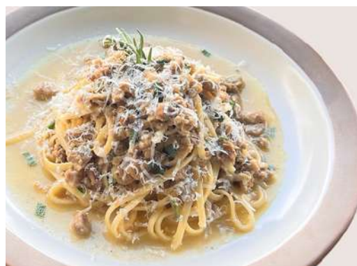
青森アップルポークの ラゲービアンコ Aomori Apple Pork, White Meat Sauce with Herbs ¥1,450-