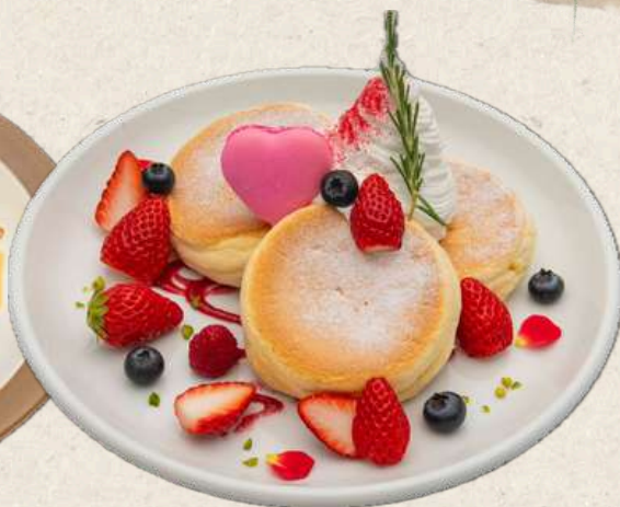
ストロベリー パンケーキ