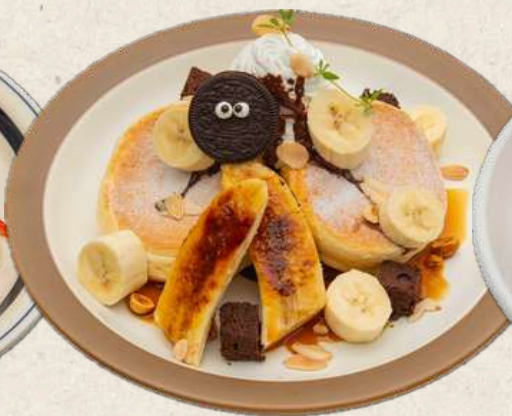
キャラメルバナナ パンケーキ