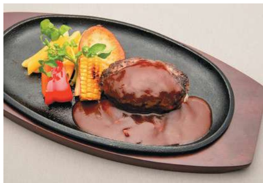
国産肉100%の手作りハンバーグ