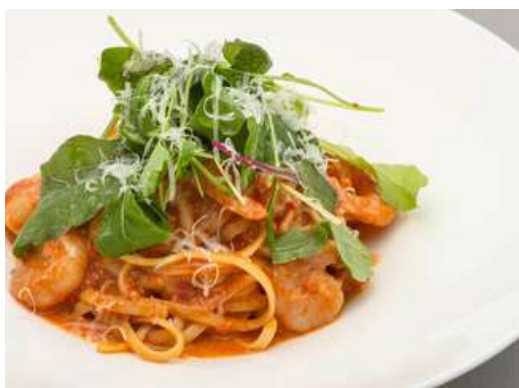
海老のパスタ アメリケーヌソース Shrimp Pasta with Americaine Sauce ¥1,760-