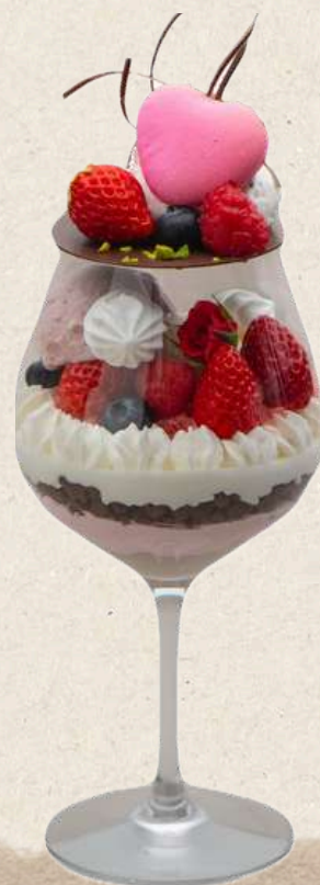
ストロベリーパフェ