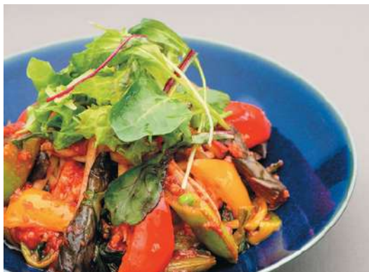
ニンニクを利かせた彩り野菜の トマトソース Garlic Tomato Sauce Pasta with Colorful Vegetables ¥1,430-